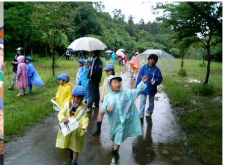
雨の中のスカウト際