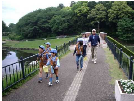
色々な自然を探し出そう