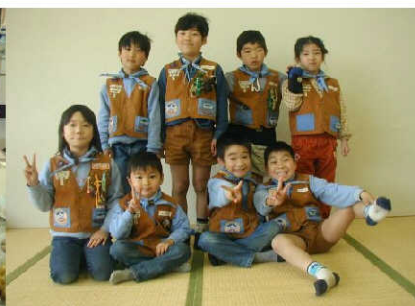
みんなで記念写真

とねがわ かせんじき さくせん 利根川河川敷クリーン作戦 がつ か にち 3月3日(日)