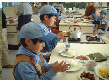
じょうず にぎ 上手に握れるかな？