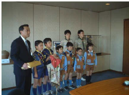
町長に募金を渡しました