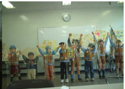
みんな色んな凧が出来ました。