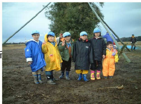
雨の上がったどんと焼き会場にて2月17日(日)