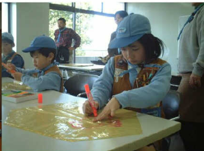
どんな凧が出来るかな？